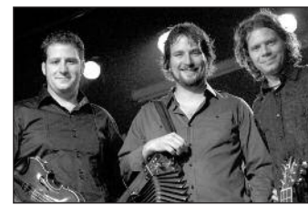
et le groupe de Temps Antan

3 décembre à 20 h À l'église de Saint-Jacques