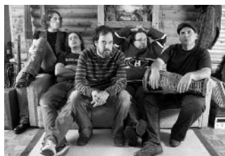
avec le groupe La Volée d'Castors